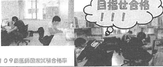
第109回医師国家試験合格率